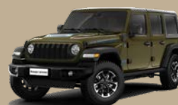
Zelená Military (BG8-822)