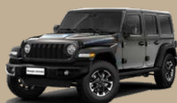
Šedá Granite Crystal (5CD-PAU)