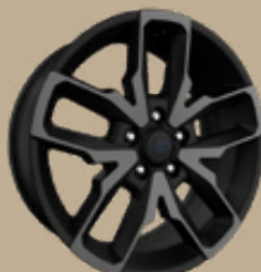
20" disky z lehkých slitin v černém odstínu s broušenou úpravou Sahara (WRA, volitelně)