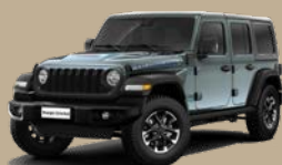
Šedá Anvil (58T-PDS)