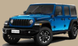
Modrá Hydro (6FW-858)