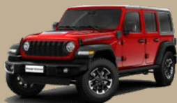
Červená Firecracker (5CB-PRC)