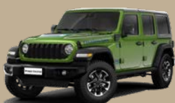
Zelená Mojito (58U-322)