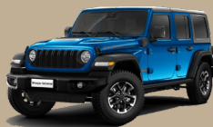
Modrá Hydro (6FW-858)