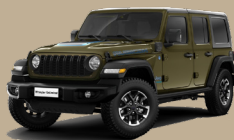
Zelená Military '41 (BG8 - 822, pouze Rubicon)