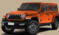
Oranžová Joose (AJ6-810)