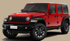
Červená Firecracker (5CB-PRC)