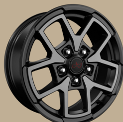
17" disky z lehkých slitin Rubicon (WFV)