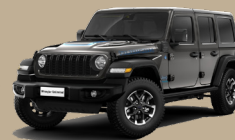
Šedá Granite Crystal (5CD-PAU)