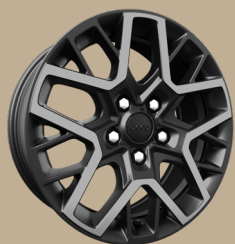
18" disky z lehkých slitin Sahara (WPA)