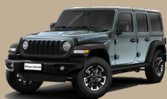
Šedá Anvil (58T-PDS, pouze Rubicon)