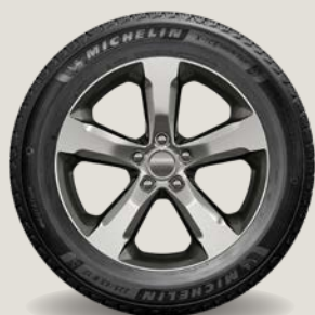
20" kola z lehkých slitin Limited (3KX)