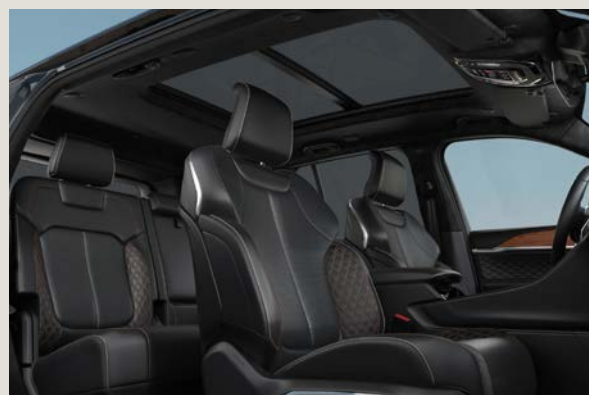
Sedadla čalouněná černou kůží Palermo (Summit Reserve X77)