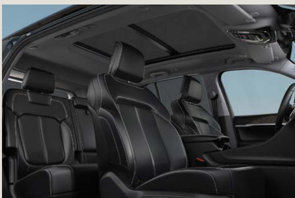
Sedadla čalouněná v kombinaci černého vinylu Capri a prvky kůže (Limited XCN)