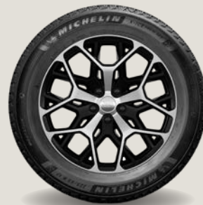
21" kola z lehkých slitin Summit Reserve (3KT)