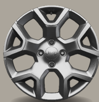
17" kola z lehkých slitin leskle stříbrná (Altitude 1M3/WAE)