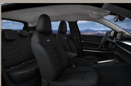
Sedadla čalouněná syntetickou kůží, stříbrná palubní deska (Altitude a Summit 1AL)