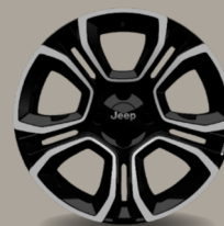
18" kola z lehkých slitin v broušené úpravě (Summit 1M5)