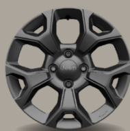
16" kola z lehkých slitin šedá (Longitude 1M1)