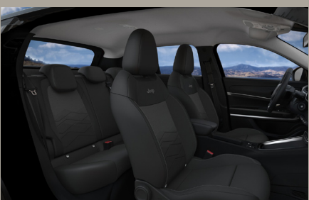
Sedadla čalouněná v kombinaci látky Robin a vinylu s šedým podkresem, stříbrná palubní deska (Altitude a Summit 1EJ)