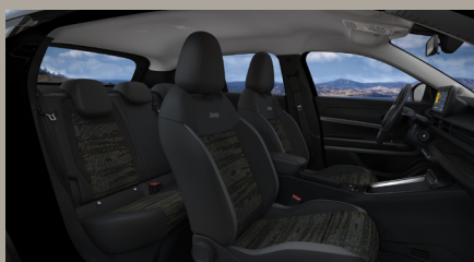
Sedadla čalouněná černou látkou Digital Jane (Longitude 1B7)