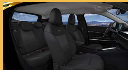
Sedadla čalouněná v kombinaci látky „Robin“ a vinylu s šedým podkresem (Altitude a Summit 1EJ)