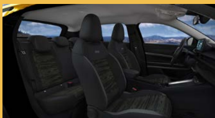
Sedadla čalouněná černou látkou „Digital Jane“ (Longitude 1B7)