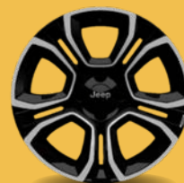
18" kola z lehkých slitin v broušené úpravě (Altitude a Summit 1M5)