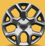
17" kola z lehkých slitin leskle stříbrná (Longitude a Altitude 1M3)