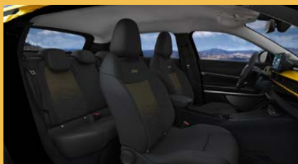
Sedadla čalouněná v kombinaci látky „Robin“ a vinylu se žlutým podkresem a žlutou palubní deskou (Summit 2ZL)