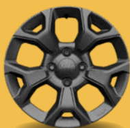
16" kola z lehkých slitin šedá (Longitude 1M1)