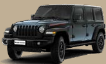
Šedá Anvil (58T-PDS, pouze Rubicon)