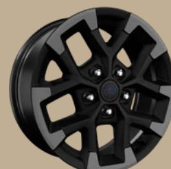
17" disky z lehkých slitin Rubicon (WFE, volitelně)