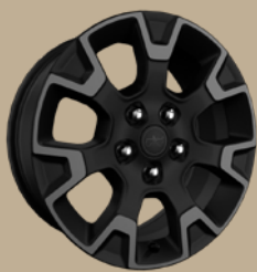
18" disky z lehkých slitin Sahara (WPD, volitelně)