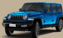
Modrá Hydro (6FW-858)