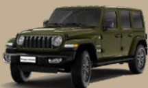
Zelená Sarge (74F-PGG)