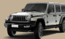
Stříbrná Zynith (2G1-699)