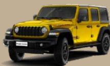
Žlutá High Velocity (2G2-596, pouze Rubicon)