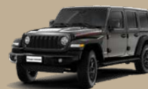
Šedá Granite Crystal (5CD-PAU, pouze Rubicon)