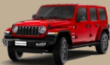
Červená Firecracker (5CB-PRC)