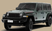
Earl (PGP-312, pouze Rubicon)