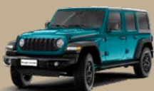
Tyrkysová Bikini (58V-221, pouze Rubicon)