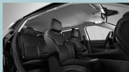
Sedadla čalouněná černou techno kůží s šedým prošíváním a odvětráváním (Summit 557)