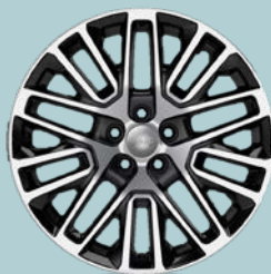
19" disky z lehkých slitin Summit (3DP)