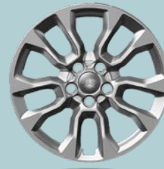
17" disky z lehkých slitin Altitude s celoročními pneumatikami M+S (1MD)