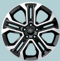
18" disky z lehkých slitin Altitude (3DM)