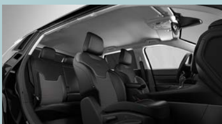
Sedadla čalouněná v kombinaci černé látky a vinylu s šedým prošíváním (Altitude 020)