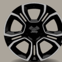
18" kola z lehkých slitin v broušené úpravě (Altitude a Summit 1M5)