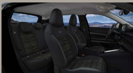
Sedadla čalouněná černou látkou Digital Jane (Longitude 1B7)