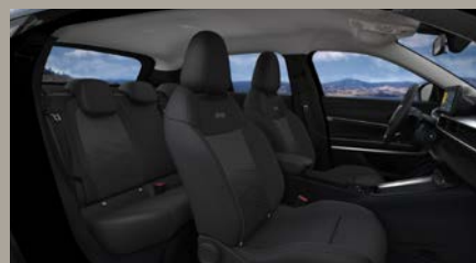
Sedadla čalouněná v kombinaci látky Robin a vinylu s šedým podkresem (Altitude a Summit 1EJ)