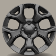
16" kola z lehkých slitin šedá (Longitude 1M1)