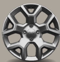
17" kola z lehkých slitin leskle stříbrná (Longitude a Summit 1M3)