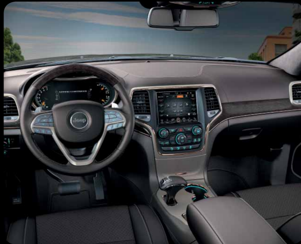
INTERIÉR GRAND CANYON V HNĚDÉ KŮŽI NATURA PLUS