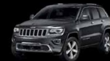
Šedá Granite Crystal