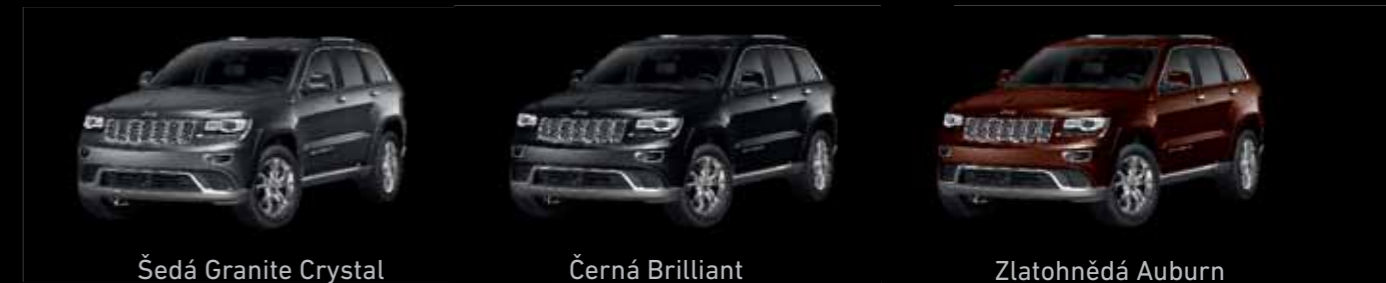
Šedá Granite Crystal