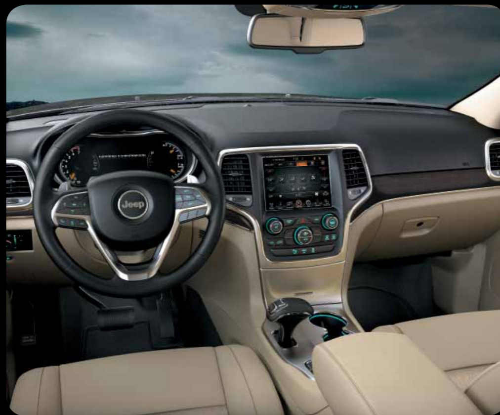
INTERIÉR NEW ZEALAND V BÉŽOVÉ KŮŽI CAPRI