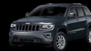
Šedá Maximum Steel