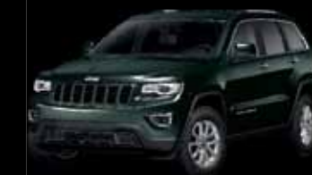
Zelená Black Forest