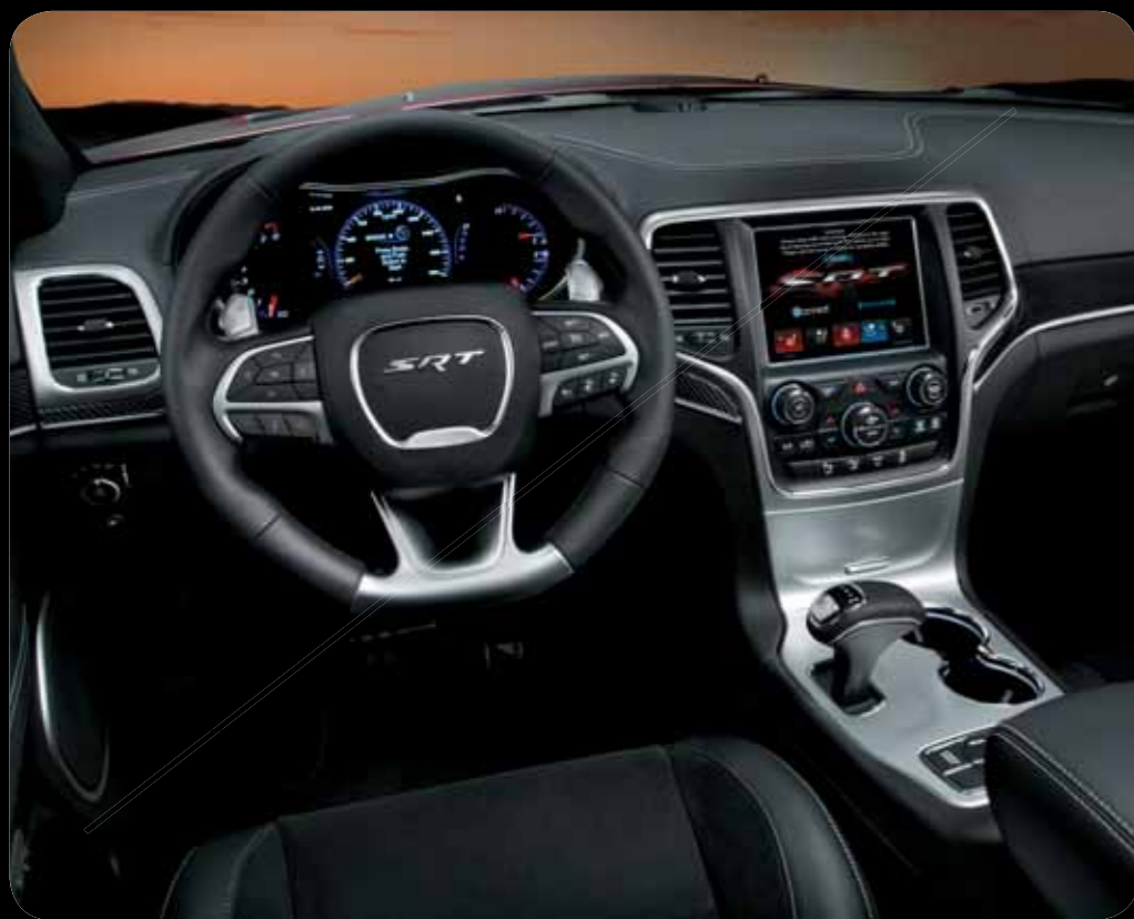
ČALOUNĚNÍ Z PERFOROVANÉ KŮŽE NAPPA A SEMIŠE V ČERNÉM ODSŤÍNU TORQUE