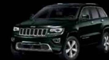
Zelená Black Forest