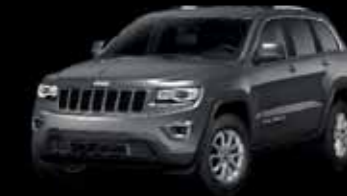
Šedá Granite Crystal