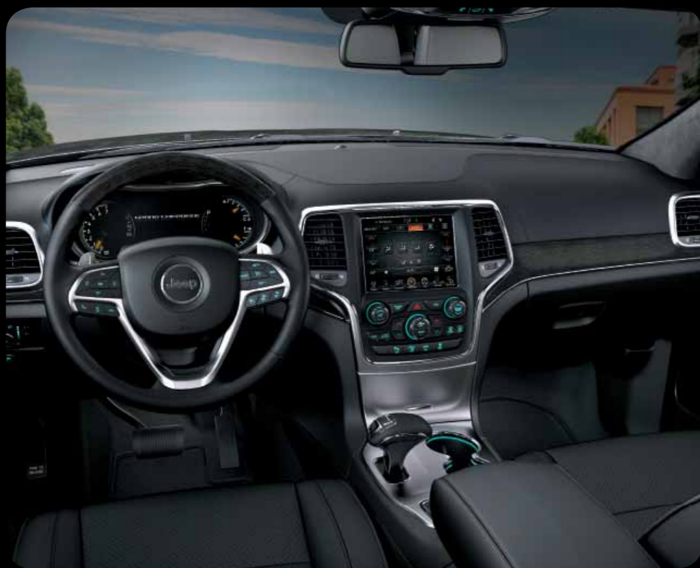
INTERIÉR MOROCCO V ČERNÉ KŮŽI NATURA PLUS