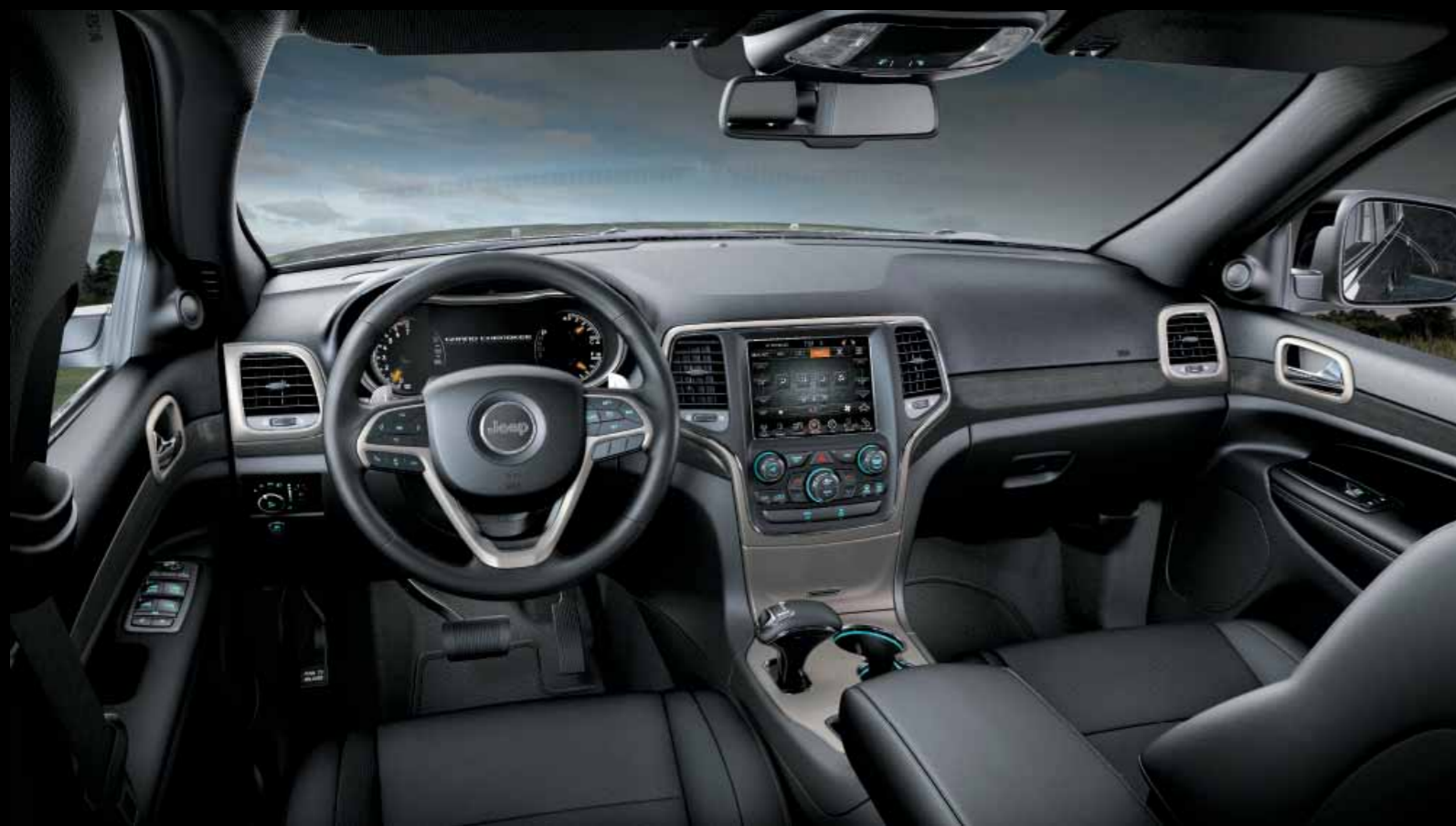
LÁTKOVÉ ČALOUNĚNÍ MOROCCO