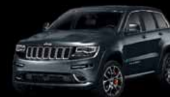
Šedá Maximum Steel