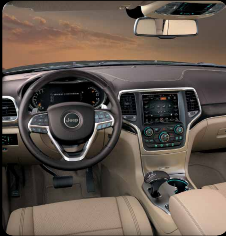
INTERIÉR NEPAL V BÉŽOVÉ KŮŽI NAPPA