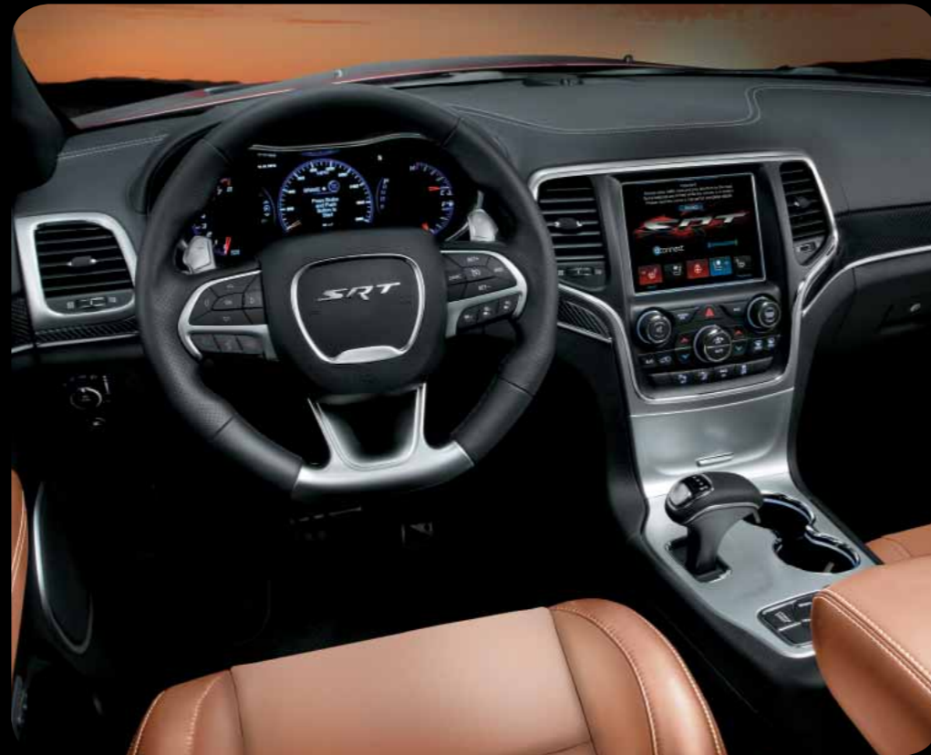
ČALOUNĚNÍ KŮŽÍ LAGUNA V ODSŤÍNU SEPIA BROWN