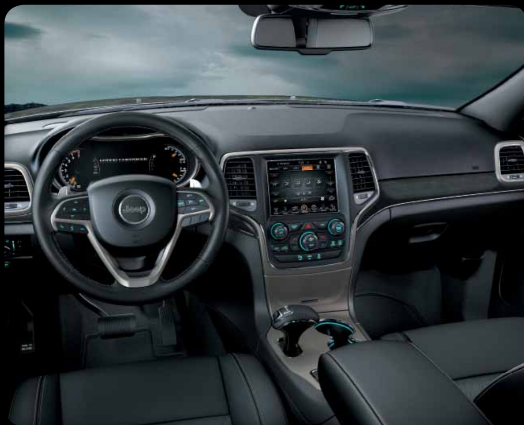
INTERIÉR MOROCCO V ČERNÉ KŮŽI CAPRI