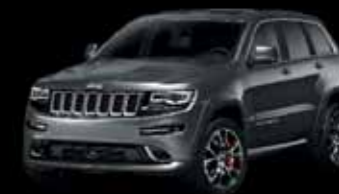
Šedá Granite Crystal