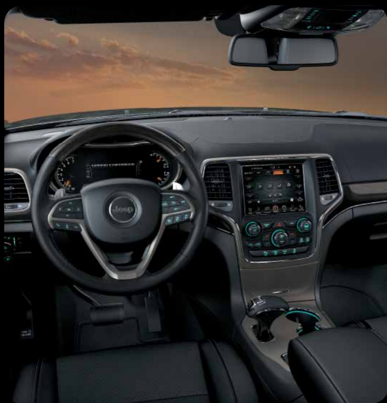
INTERIÉR MOROCCO V ČERNÉ KŮŽI NAPPA