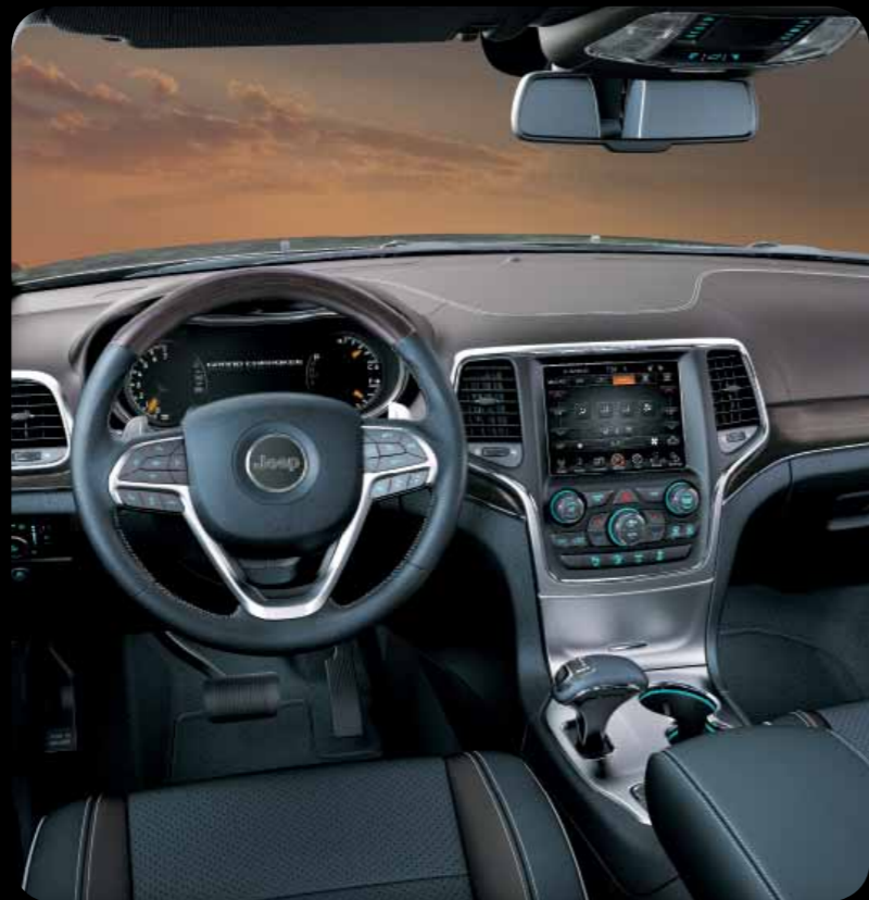
INTERIÉR VESUVIO V HNĚDO-MODRÉ KŮŽI NAPPA